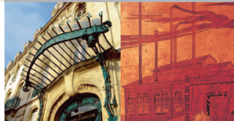
Chambre de Commerce et d'Industrie

1 | L'Est Républicain 1912 5 bis, avenue Foch Architecte Pierre Le Bourgeois