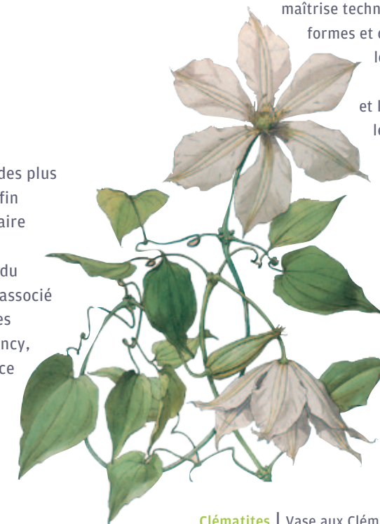
Clématites | Vase aux Clématites, Musée des Beaux-Arts

Longévité et créativité caractérisent l'une des plus grandes cristalleries françaises, créée à la fin du XIX e siècle et qui a su, au fil du temps, faire évoluer ses fameuses pâtes de verre. Des maîtres de l'Art nouveau aux grands noms du design contemporain, Daum s'est toujours associé aux plus brillants créateurs. Aujourd'hui, les cristalleries Daum, toujours installées à Nancy, dans la rue qui porte leur nom perpétuent ce savoir-faire unique. Sur la place Stanislas, une boutique expose le travail de ces génies de l'art du verre.